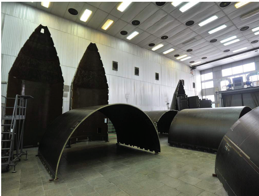
Рисунок 1 – Вуглепластикові елементи корпусу космічного апарату

Найчастіше для визначення пружних та в'язкопружних властивостей ортотропного матеріалу використовують тонкостінні елементи, такі як пластинки та оболонки. Зокрема, в роботі [2] продемонстрована методика визначення пружних характеристик ортотропних пластин довільної форми за допомогою статичного згинального навантаження її зосередженими силами в певних точках. Стаття [3] описує спосіб отримання пружних характеристик ортотропної прямокутної пластини при збудженні в ній так званих хвиль Ламба. В праці [4] йдеться мова про визначення пружних характеристик ортотропної пластини, що має різні напрямки армування, за допомогою динамічного експерименту.