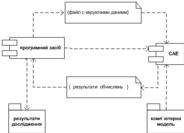
Рисунок 2 – Діаграма компонентів програмного комплексу на базі типового відокремленого CAE

Інші етапи виконуються у відповідності з особливостями програмного забезпечення що використовується в дослідженні.