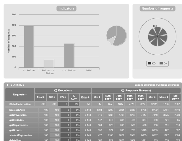
Рис. 3 – Звіт сценарію з 100 користувачів

На рис. 3 зображено результат сценарію в якому намагається одночасно зареєструватись 100 користувачів. Всі запити, так само, як і в першому сценарії, виконані успішно, але з такою кількістю користувачів займають в середньому 1788мс. Найдовшим був запит в сервіс авторизації (крок 1), він зайняв 9792мс. Найкоротшим в сервіс електронного навчання (крок 3, діставання інформації про інститути), він зайняв 147 мс.