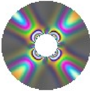
Рисунок 1 – Вид плосконапряженного тела в скрещенных поляроидах